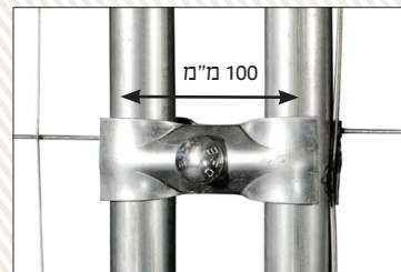
מידות הרשת: ("עין"): 250 מ"מ על 50 מ"מ